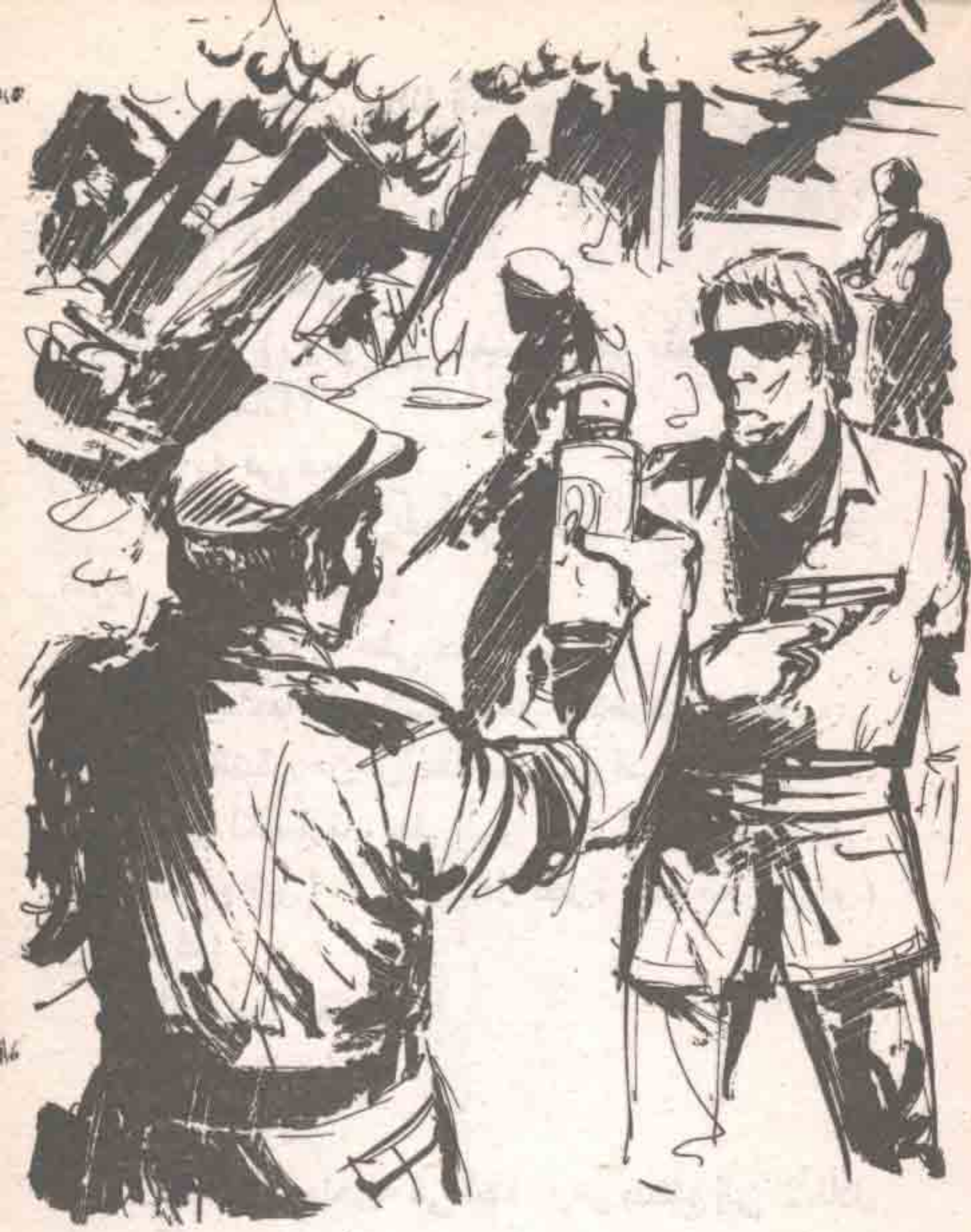
واقترب منه (روكو) ، وهو يحمل زجاجة من بخاخات المبيدات الحشرية ، وقد التصقت بها قارورة صغيرة ...

واقترب منه (روكو) ، وهو يحمل زجاجة من بخاخات المبيدات الحشرية ، وقد التصقت بها قارورة صغيرة ، تحوى سائلا نصف شفاف ، وقال :